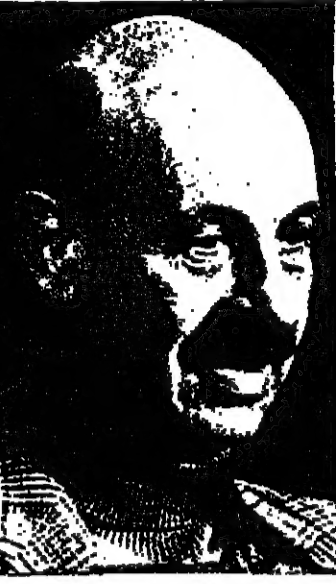
البروفيسور يهودا بلوم في الكلمة التي القاها بهذه المناسبة : ان السلام على الابواب اذا علم اسرائيل برونف في القاهرة ، لكن جيراننا في الشمال والشرق يعملون كل ما في وسعهم لتقويض اساس السلام ويضطلعون بالايادة دولة اسرائيل .

بئر السبع - عقيم - اقيم في احدى قواعد سلاح الجو الاسرائيلي امس احتفال بمناسبة تخريج نفعة جديدة من الطيارين اشترك فيه البروفيسور يهودا بلوم رئيس الحكومة ووزير الدفاع بالوكالة والجنرال رفائيل ايتان رئيس اركان جيش الدفاع وقائد سلاح الجو الميجر جنرال دايفد عبري ، ووزير الصناعة والتجارة السيد جديعون بات ، وعدد كبير من ضباط وجنود سلاح البحرية .